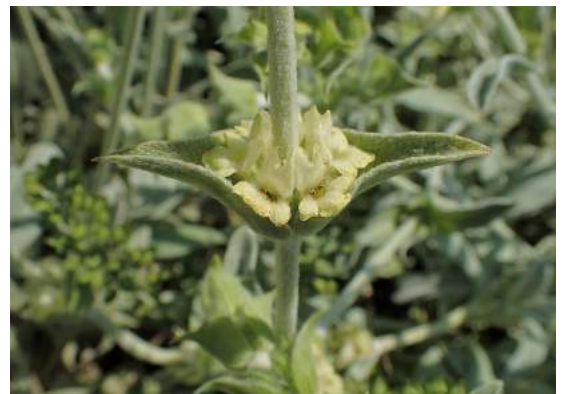
Griechisches Eisenkraut ( Sideritis scardica )