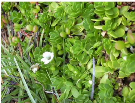
Brahmi ( Bacopa monnieri )