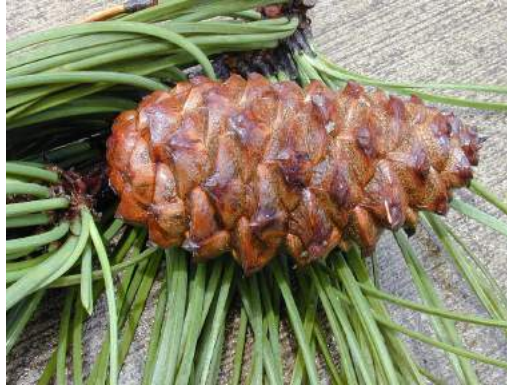
Französische Meereskiefer (Pinus pinaster)