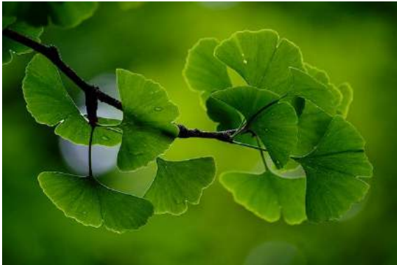
Ginko ( Ginkgo biloba )